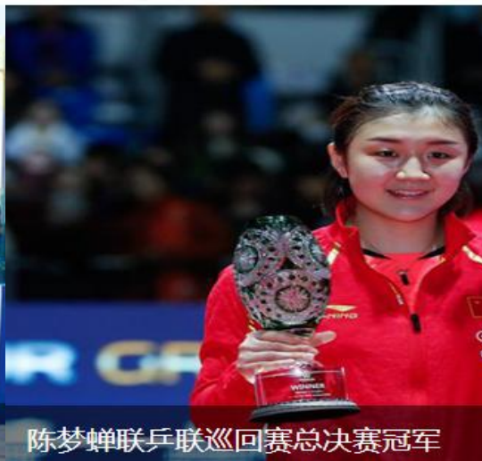
陈梦蝉联乒联巡回赛总决赛冠军

2. 聚焦“放管服”改革做好公开。公开行政审批事项名称、审批依据、办事指南、受理条件和办理标准，优化审批流程、减少审批环节，及时向社会公开办理环节和办理进度。按照《山东省体育局推行“双随机、一公开”监管工作实施方案》，认真开展射击竞技体育运动单位检查和经营高危险性体育项目许可监督检查，并在局官方网站公开检查结果。对政务服务办事咨询系统”的 15 件来件咨询认真回复，全部按期办理。