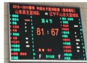
山东西女篮主场胜辽宁千山忠大 时间 2019-01-22 点击量: 154