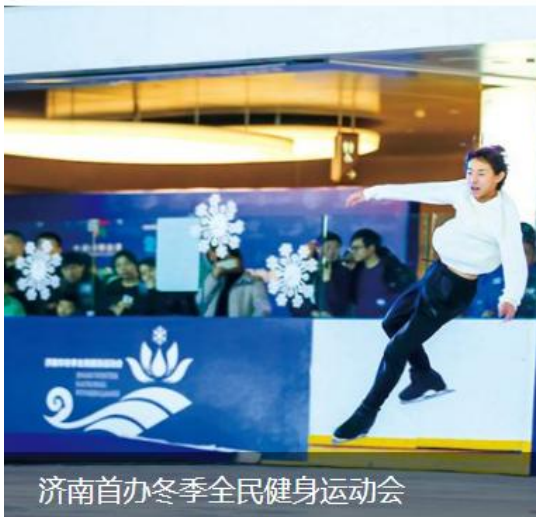
济南首办冬季全民健身运动会