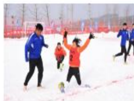
山东省冬季全民健身运动会: 雪地足球烟台开战 时间 2019-01-22 点击量: 120