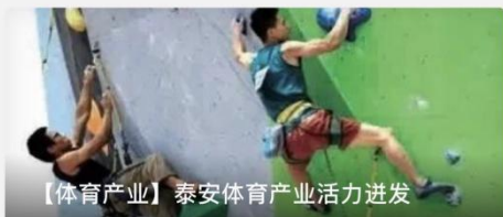
【体育产业】泰安体育产业活力迸发