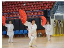
2019长岛太极展演第一“舞” 时间 2019-01-22 点击量: 222