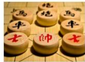
长岛举办全民健身中国象棋赛 时间 2019-01-22 点击量: 171